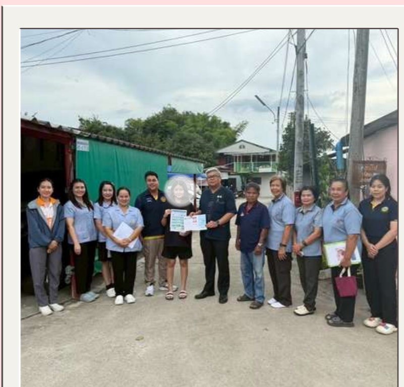
ลงพื้นที่ ติดตามเยี่ยมบ้าน