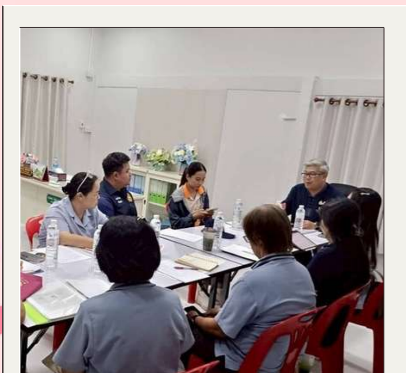
จัดตั้งทีมงานลงพื้นที่