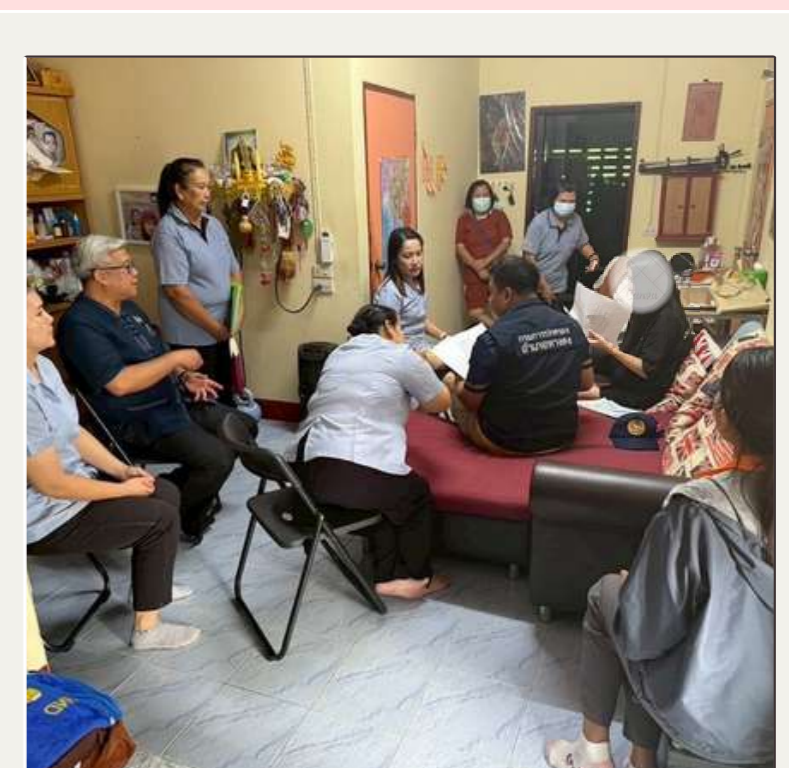
ลงพื้นที่ ติดตามเยี่ยมบ้าน