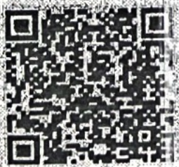
สแกนเพื่อสมัครเข้าร่วมกิจกรรมฯ

รองผู้ว่าราชการจังหวัด ปฏิบัติราชการแทน ผู้ว่าราชการจังหวัดเชียงใหม่