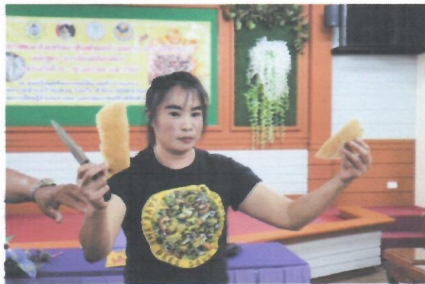
/ภาพกิจกรรม...