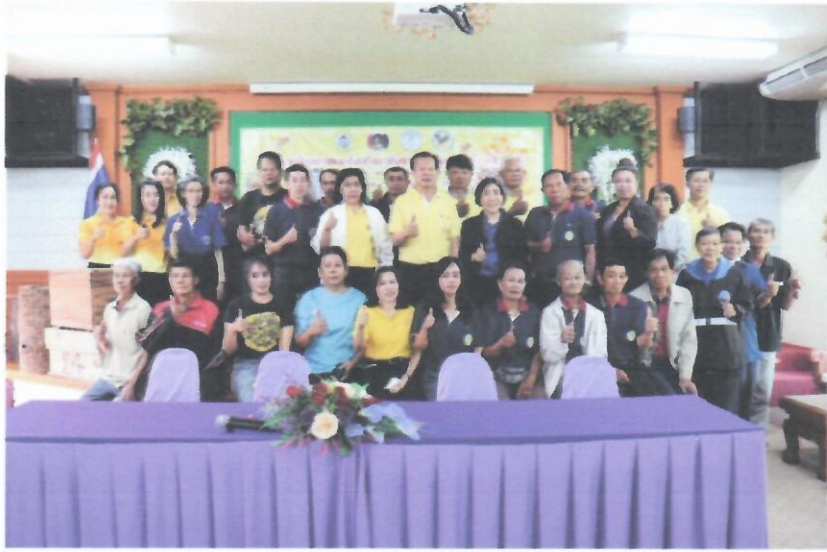
วันที่ ๑๘ มกราคม ๒๕๖๗ การเลี้ยงผึ้งโพรงไทย