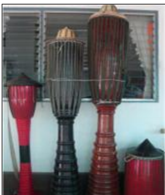
กลองปู้เจ้ (ปู้จา)