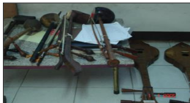
ซอและซิ้ง