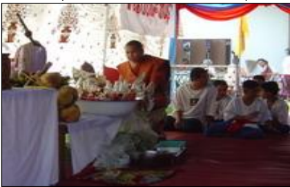
๗.๓ ภูมิปัญญาท้องถิ่น ภาษาถิ่น